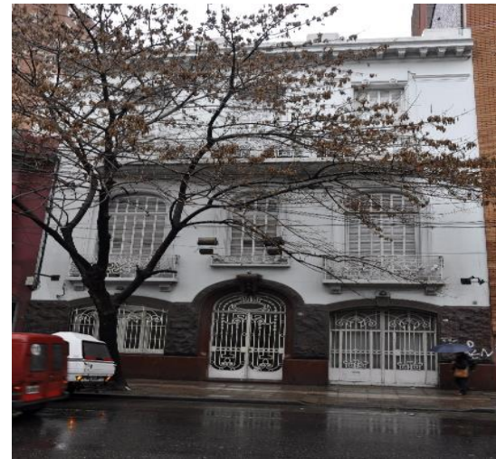
2013: Sede Medrano