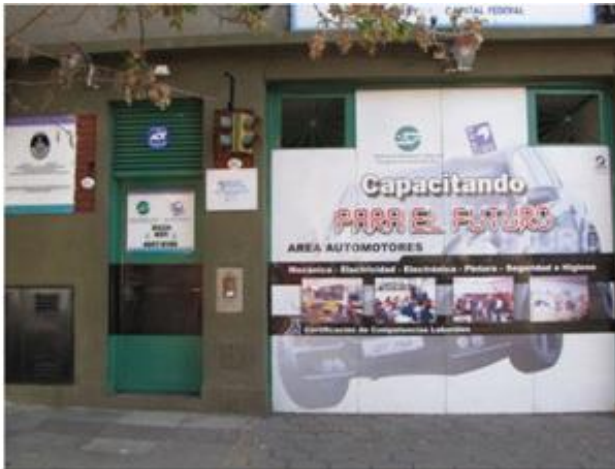
1989: Sede Maza