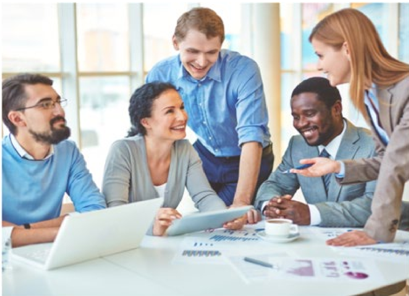
ENSEÑAR UN CURSO